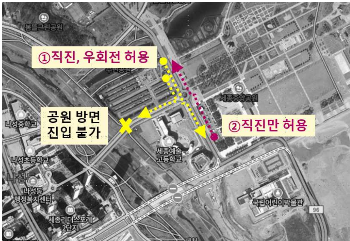
회전교차로 회전 제한, 직진만 허용